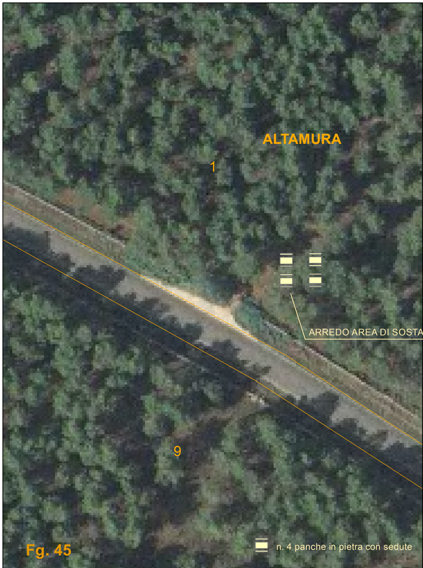
PLANIMETRIA AREA DI SOSTA SCALA 1:500